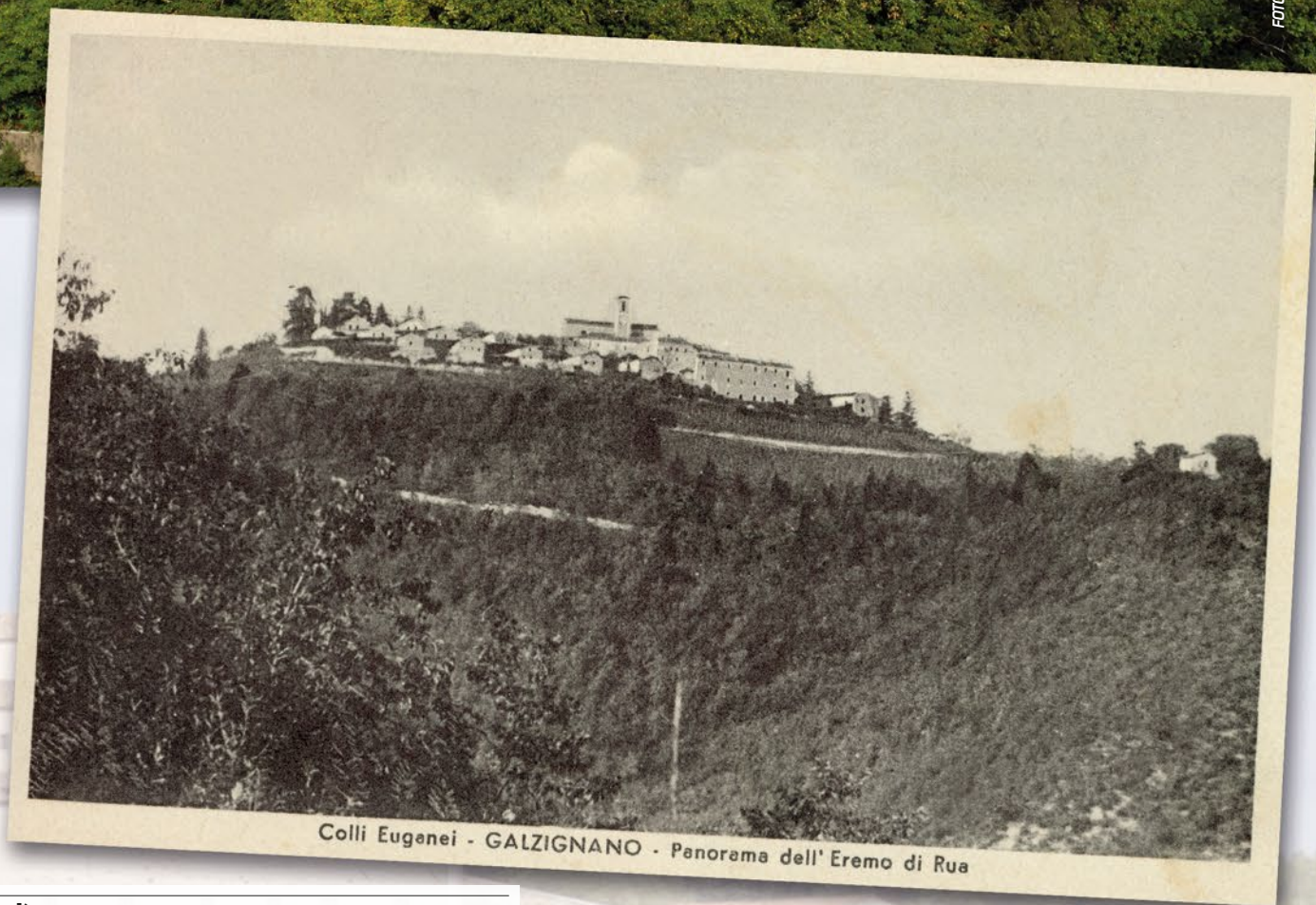
Colli Euganei - GALZIGNANO - Panorama dell'Eremo di Rua