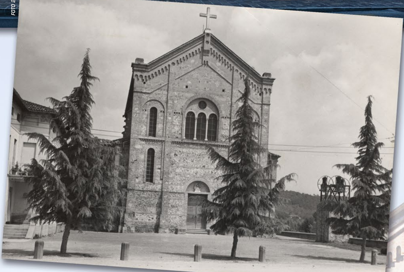
Chiesa Sacro Cuore di Gesù