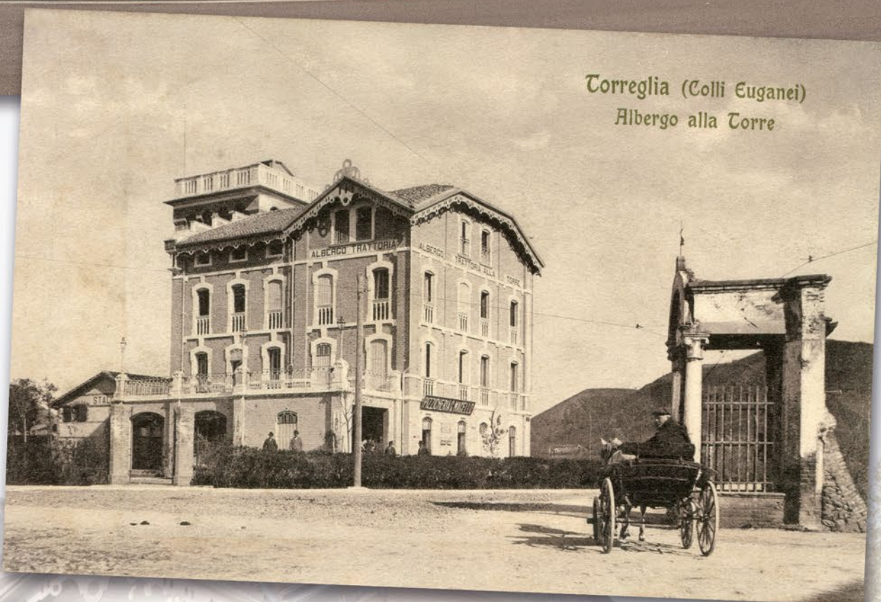
Torreglia (Colli Euganei) Albergo alla Torre