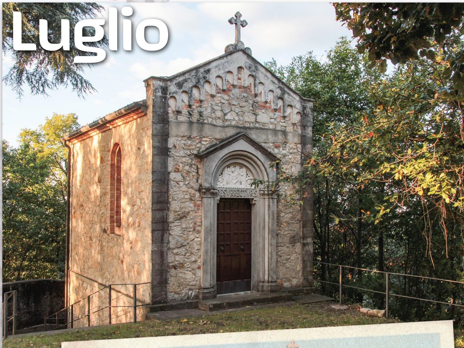
Sepolcreto Eremo del Monte Rua