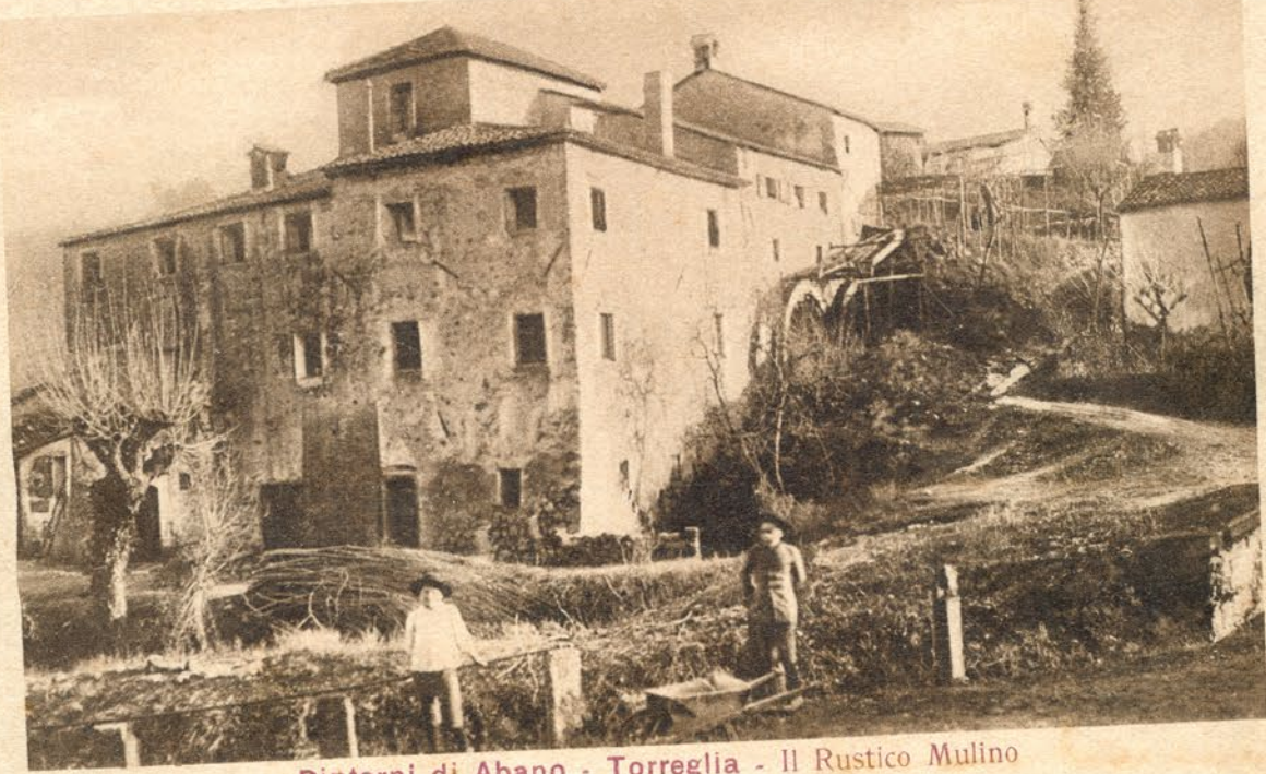
Dintorni di Abano - Torreglia - Il Rustico Mulino