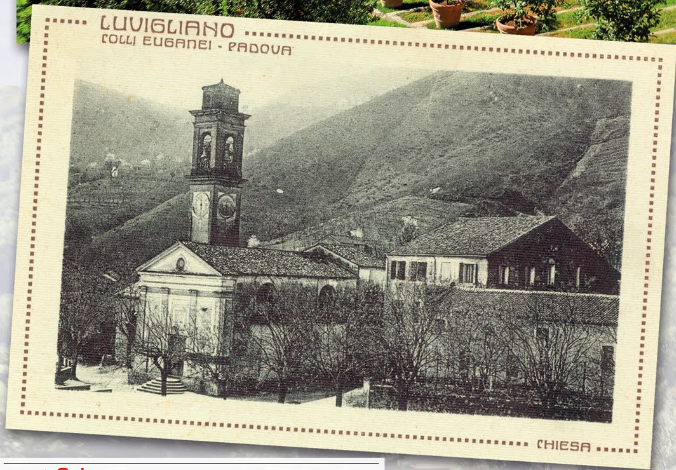
Chiesa di San Martino