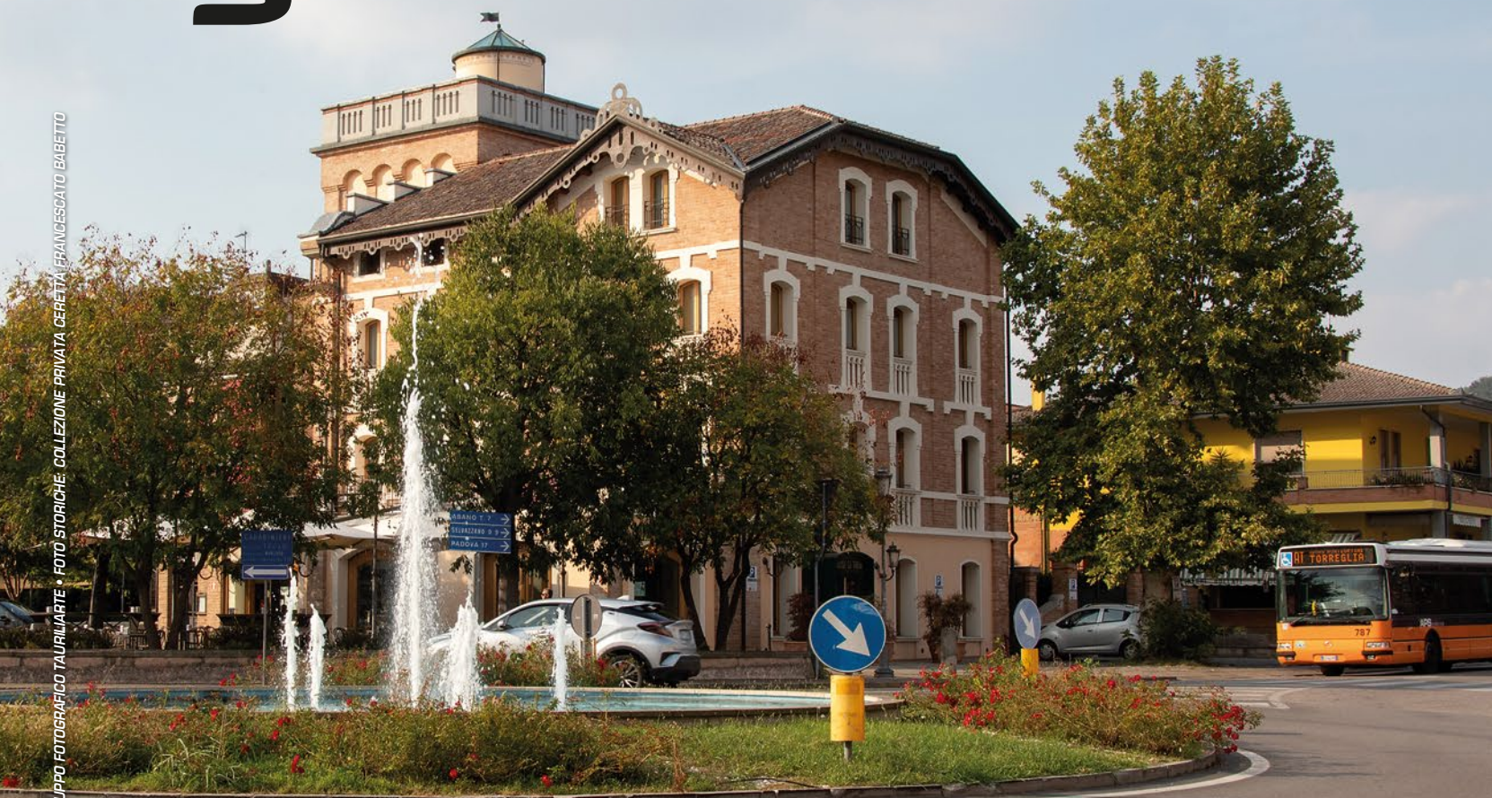
Villa Corinaldi La Torre