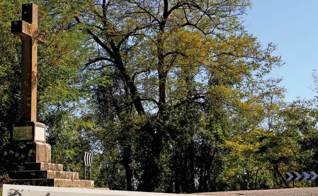
Croce Monte Rua