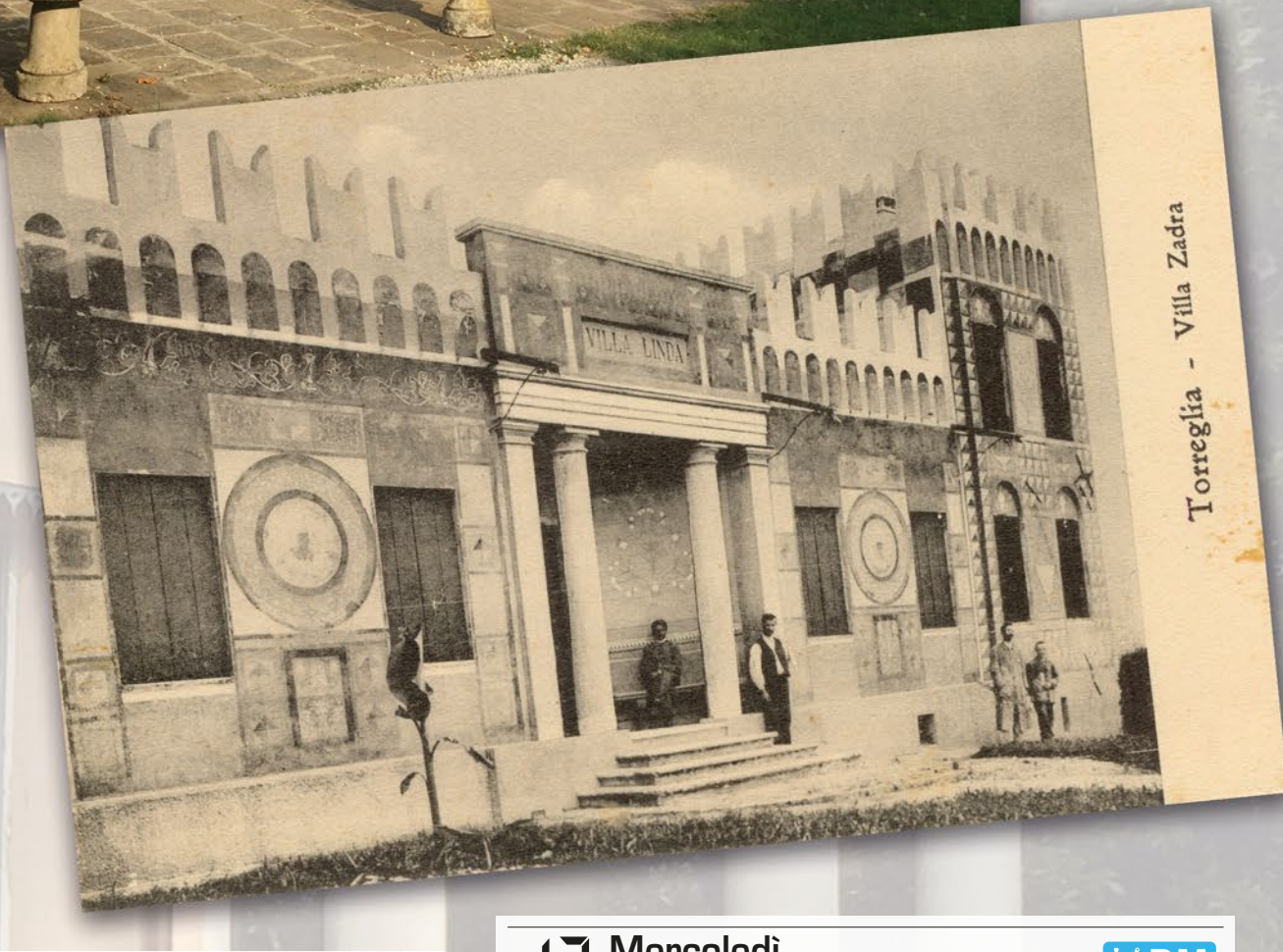
Torreglia - Villa Zadra