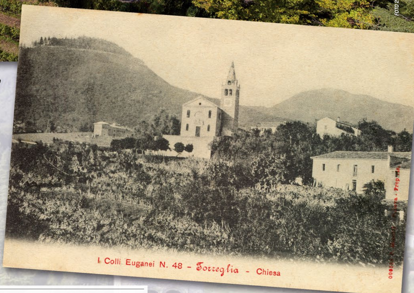
Chiesa di San Sabino