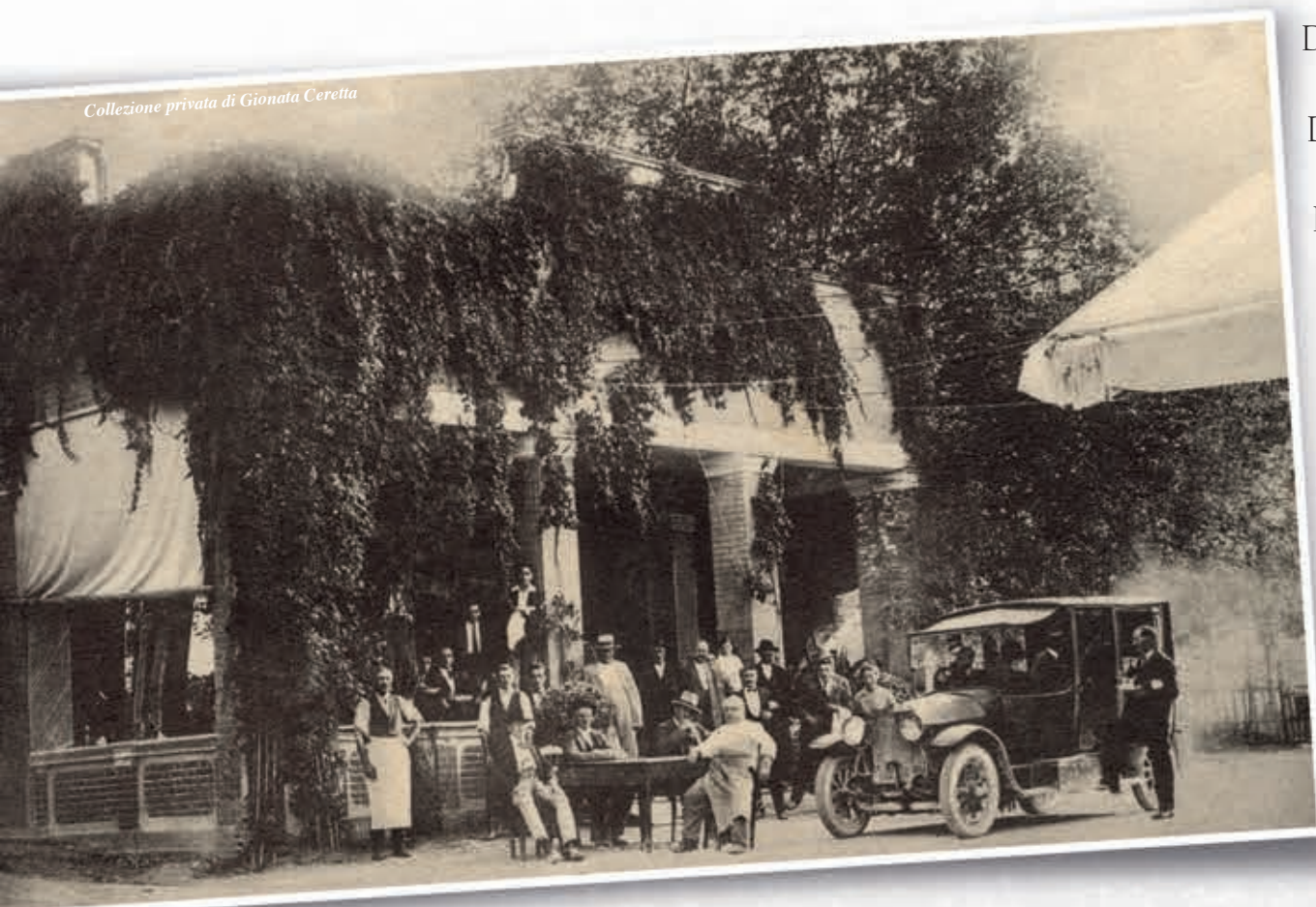
1924 – Trattoria Ballotta, la più antica dei Colli Euganei, fondata nel 1605. Il nome “Ballotta” pare derivi dal soprannome “baeotta” (persona in carne) dato all’antico gestore.

De Benetti Finesso De Franceschi Manoi Dei Agnoli Dea Guardia De Battisti Marcheto Desiderato Modin, Granpè, Gainari, Macera Fabris Patarina Facciolati Bricia