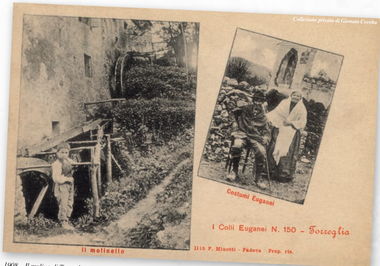
1908 - Il mulino di Torreglia Alta presso il Rio Calcina e due contadini dei Colli Euganei fotografati tra Torreglia e Galzignano.

Lazzarini Lataroeo Lazzaro Nanon Legnaro Goti, Lia Lionello Petareo, Mianta, Peo, Pagnache, Giona, Taboga Lunardi Marcioro, Trivein Marcolin Peransan Marconato Castean