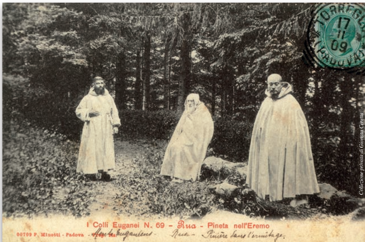
1909 - Eremo del monte Rua. Il toponimo Rua nella lingua veneta ricorda la parola "ruota" ma probabilmente risale al termine "ruah" che in ebraico significa "spirito". L'Eremo dei padri camaldolesi ha vissuto tre fondazioni: 1334-1420 circa, 1537-1810 e dal 1863 ai giorni nostri.