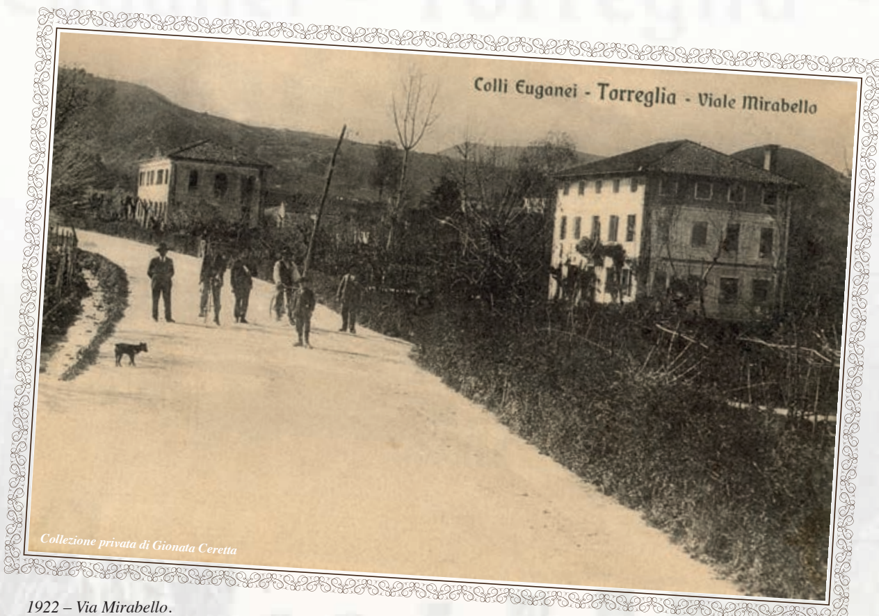
1922 - Via Mirabello. Sullo sfondo a sinistra l'originario edificio degli uffici comunali e delle scuole elementari che oggi ospita la Biblioteca Comunale.