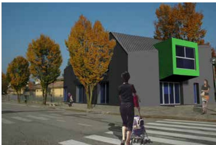
Rendering della nuova struttura, colori indicativi

Sarà quindi un edificio che mira a soddisfare i bisogni emersi in questi anni dalla collettività e dal mondo associativo, ossia un luogo dove potersi incontrare nel tempo libero per organizzare e programmare attività, uno spazio che favorisca momenti di confronto e permetta di promuovere serate culturali o formative, oltre ad un'opportunità per la scuola a supporto delle attività didattiche. Tutto sarà normato da un dettagliato regolamento, affinché chiunque ne faccia richiesta possa accedere e trarne beneficio. Inizia pian piano a prendere forma l'idea di vedere "Piazza Mercato" come il luogo che richiama la vita cittadina, consentendoci di apprezzare e riappropriarci di un paesaggio incantevole.