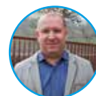
di Alessandro Moronato

Il periodo natalizio è tradizionalmente un motivo in più per stare insieme, rivederci in piazza e per scambiarci gli auguri di Natale, e al contempo ringraziare tutte le associazioni, i gruppi e tutti i volontari che durante l'anno sostengono la comunità nei modi più diversi. La volontà, la passione e la disponibilità che tutte queste persone hanno dimostrato anche in questo periodo ci rendono sempre entusiasti e ci stimolano nel proporre nuove idee e iniziative per coinvolgere i nostri concittadini e per far conoscere sempre più le bellezze di Torreglia.