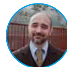
di Marco Rigato